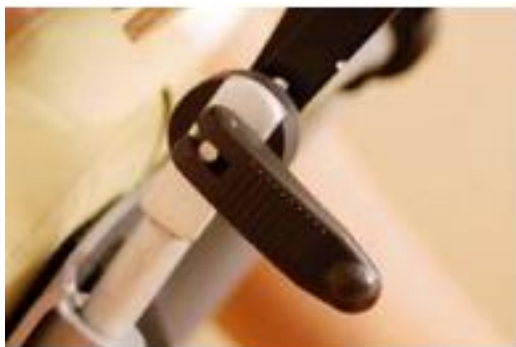
GALVOS ATRAMOS NUOLYDŽIO REGULIAVIMAS (9) Atlaisvinkite, reguliuokite, fiksuo­kite.