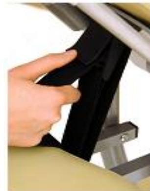
RANKŲ ATRAMOS REGULIAVIMAS DIRŽELIU (7) Atlaisvinkite, reguliuokite, fiksuo­kite.