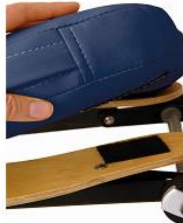
VEIDO ATRAMOS TVIRTINIMAS (1)