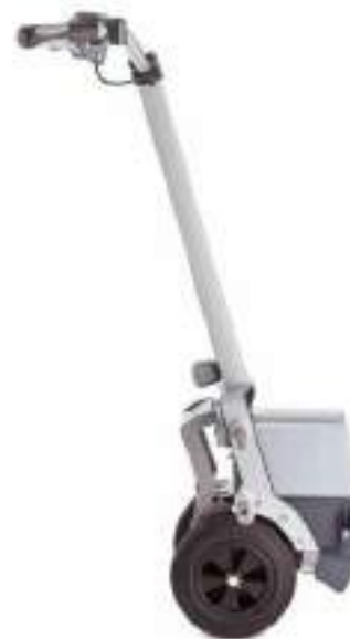
Viamobil eco: su pradūrimams atspariomis padangomis, baterija, įkrovikliu ir valdymo prietaisu.

Vežimėlio varymas gali būti lengvas – tai patvirtino Techninės apžiūros centras (TUV) – nepriklausoma organizacija, testuojanti įrenginių kokybę ir patikimumą. Šios organizacijos teigimu, varytuvą viamobil eco „Paprasta valdyti“.